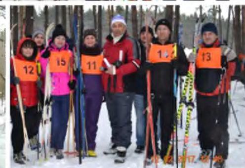
СТУДЕНТЫ БОРИСОГЛЕБСКОГО ДОРОЖНОГО